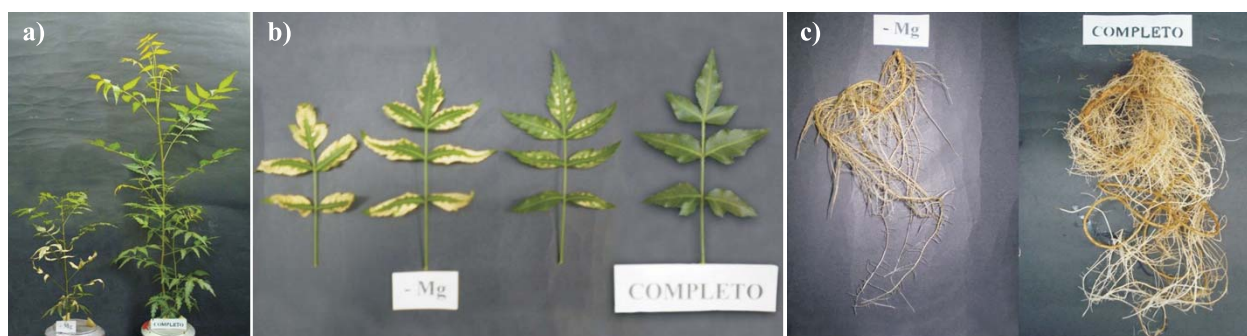
Figura 5 – Planta de nim com tratamento de omissão de magnésio comparada a uma cultivada em solução nutritiva completa: a) parte aérea; b) folhas e c) raízes.

Figure 4 – Neem plant treated with the omission of calcium compared to a plant treated with complete nutritive solution: a) aerial part; b) leaves and c) roots.