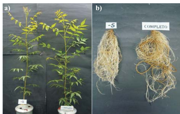
Figura 6 – Planta de nim com tratamento de omissão de enxofre comparada a uma cultivada em solução nutritiva completa: a) parte aérea e b) raízes.

Sintomas característicos de deficiência de S não foram observados durante o período experimental, assim como no tratamento com omissão de K, pois verificou-se, somente aumento na quantidade de radicelas (Figura 6b), porém não se observou diminuição no crescimento das plantas.