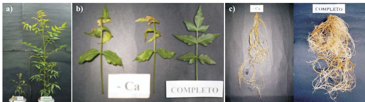
Figura 4 – Planta de nim submetida ao tratamento com omissão de cálcio comparada a uma cultivada em solução nutritiva completa: a) parte aérea; b) folhas e c) raízes.

Os primeiros sintomas de deficiência de Mg foram verificados aos 45 dias, após o início dos tratamentos, em que observou-se clorose internerval em direção à borda, nas folhas mais velhas (Figura 5b). Essa sintomatologia, com o decorrer do tempo, foi observada nas folhas intermediárias, sendo que as mais velhas tornaram-se amareladas. A clorose das folhas está associada à menor produção de clorofila. Sintomas semelhantes foram detectados por Gonçalves et al. (2006) em mudas de pupunheira, no tratamento com omissão de Mg.