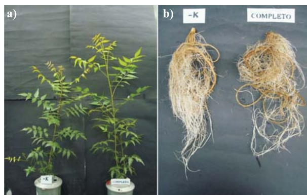
Figura 3 – Planta de nim submetida ao tratamento com omissão de potássio comparada a uma cultivada em solução nutritiva completa: a) parte aérea e b) raízes.

Figure 2 – Neem plant treated with the omission of phosphorus compared to a plant treated with complete nutritive solution: a) aerial part and b) roots.