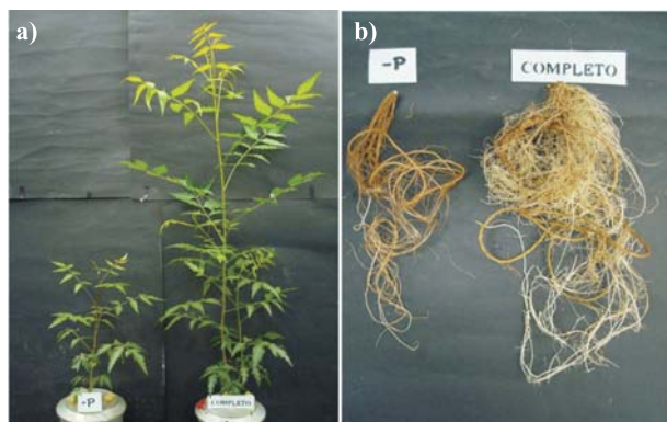
Figura 2 – Planta de nim submetida ao tratamento com omissão de fósforo comparada a uma cultivada em solução nutritiva completa: a) parte aérea e b) raízes.

Figure 1 – Neem plant treated with the omission of nitrogen compared to a plant treated with complete nutritive solution: a) aerial part; b) leaf, and c) roots.