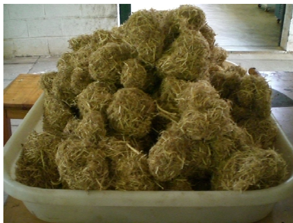
Figura 1 – Envelamento das partículas de vassoura.

os painéis foram produzidos numa prensa de laboratório, marca INCO, empregando-se uma pressão de 32 kgf/cm 2 , a uma temperatura de 170°C, por 8 minutos, contados a partir do fechamento da prensa.