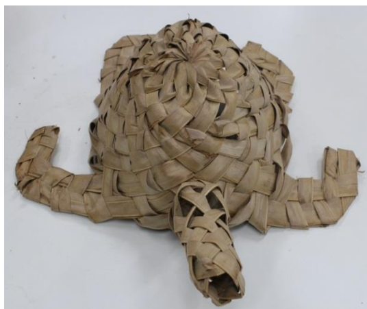
Imagem 6: Tartaruga