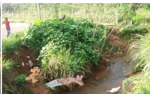
Imagem 2: córrego na cidade