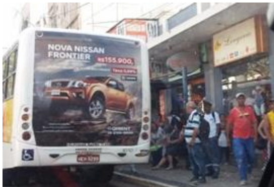
Imagem 1: propaganda no ônibus

Na segunda etapa do minicurso os participantes observaram as imagens dispostas e escolheram algumas que os chamaram atenção. Essas imagens foram levadas para discussão em roda, onde cada um compartilhou com o grupo sua imagem e os motivos que levaram a escolha delas.