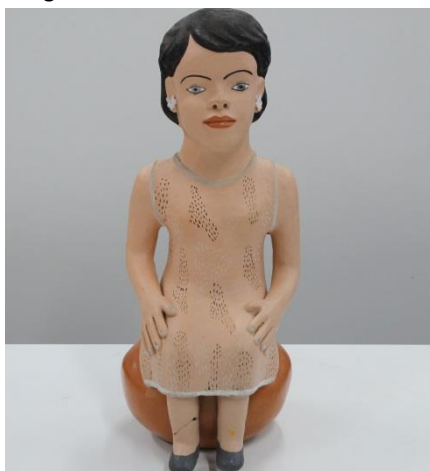
Imagem 5: Boneca de barro