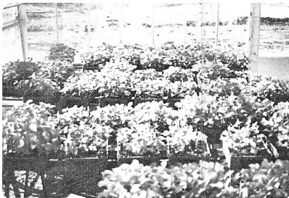
FIGURA 1. Vista parcial do Experimento I, Casa de Vegetação, ESAL, Lavras, MG., 1977.

4.2. Efeito do tratamento de duas classes de sementes de soja ( Glycine max L. Merrill), com fungicidas sistêmicos e protetores usados isoladamente ou em mistura sobre a emergência e desenvolvimento das plântulas