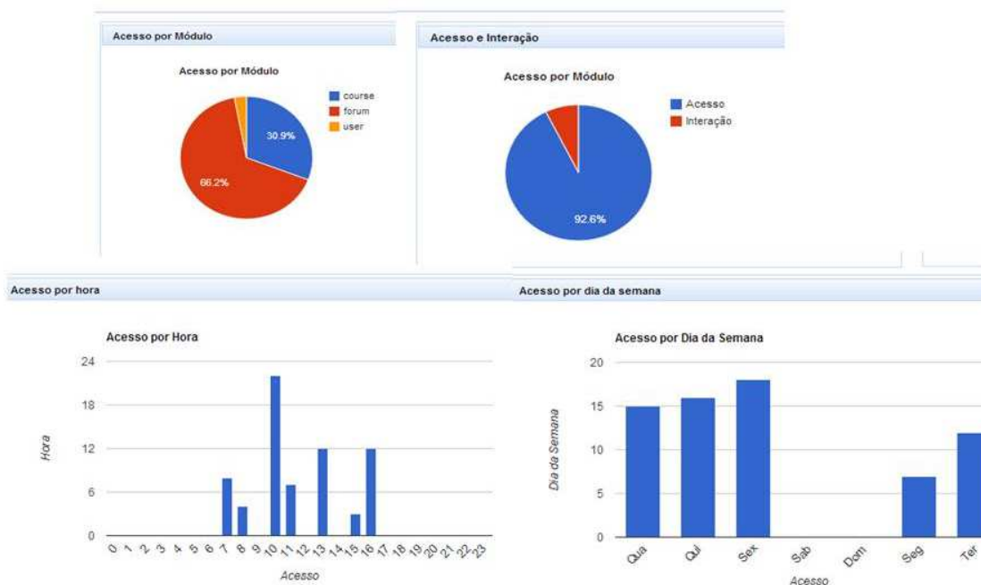
Figura 3. Gráficos do GIAVA demonstrando a participação do tutor por hora e por semana nas atividades, os dados auxiliam no lançamento dos conceitos no painel de avaliações.

As variáveis analisadas são semelhantes àquelas encontradas nas planilhas, entre essas: a) número de acesso ao AVA; b) percentual de cliques utilizados para interação com os cursistas por meio de mensagens no fórum de dúvidas e mensagens privadas; d) intervenções; e) avaliação da qualidade ortográfica e de vocabulário utilizados durante as postagens; f) participação na sala de tutoria da disciplina (Figura 3).