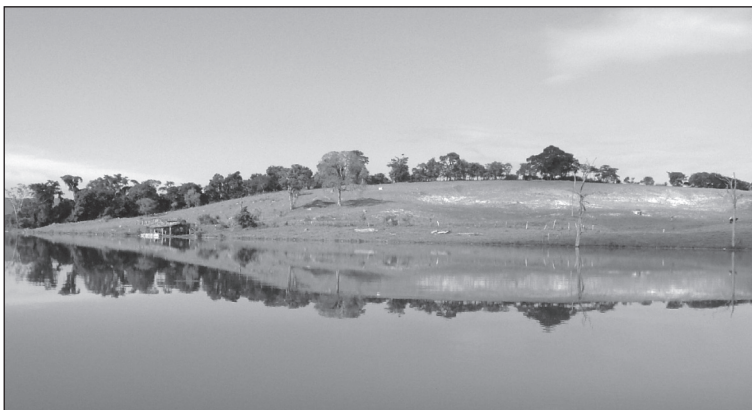
FIGURA 8. Paisaje con el «efecto espejo perfecto», puntuada en el entorno del embalse de la UHE Funil, en el municipio de Ijaci, Lavras, MG.

Dado el interés y el atractivo que revisten las masas de agua, pero a la vez, el valor homogéneo que en el ámbito de estudio tiene, dada su calidad (turbidez) y su carácter predominante, ya que se han evaluado los paisajes ribereños del embalse, se incluye el paisaje con «efecto espejo perfecto» puntuado con el máximo valor (5) para la calidad del agua (NTU = 9.06). Se localiza (figura 8) en la propiedad rural de Don Tónico Leôncio (coordenadas geográficas UTM: X = 509033.788 m E; Y = 7660969.018 m N). Es la luminosidad, la calidad y el efecto lumínico del agua dada su gran transparencia la que determina la atracción ejercida por esta unidad paisajística.