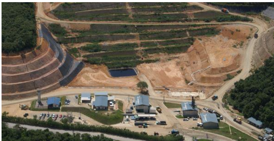
Figura 5: Vista do Aterro CTR Nova Iguaçu.