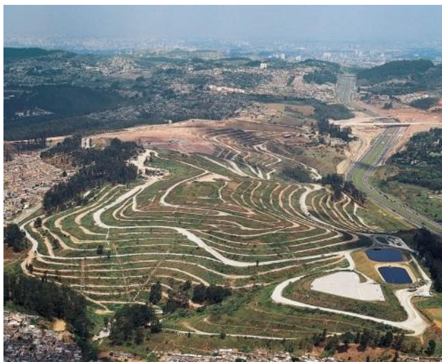
Figura 3: Vista do Aterro Bandeirantes