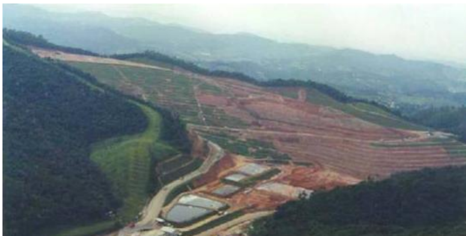
Figura 4: Vista Geral do Aterro São João.