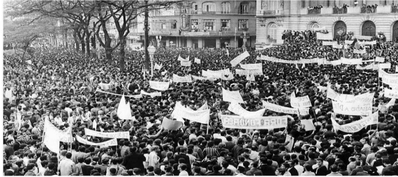
A "Passeata dos Cem Mil", manifestação organizada no Rio de Janeiro pela UNE, em 26 de junho de 1968, contra o governo militar

Dilma - A gente tinha que fazer uma moldura e só se lembrar da moldura, da história que se inventava, e não sabia disso. Tinha que ter uma história. Na relação do torturador com o torturado a única coisa que não pode acontecer é você falar "não falo". Se você falar "não falo", dali a cinco minutos você pode ser obrigado a falar, porque eles sabem que você tem algo a dizer. Se você falar "não falo", você diz pra eles o seguinte: "Eu sei o que você quer saber e