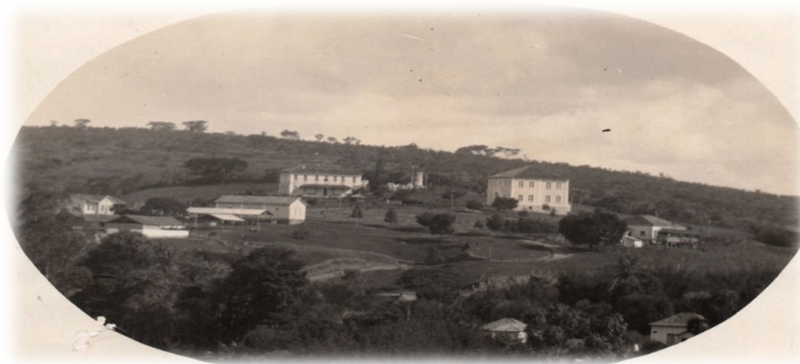
Figura 1. Fotografia panorâmica das edificações (ao fundo) que deram origem à ESAL.

Em 13 de novembro de 1969, o Conselho Departamental da ESAL – mediante o decreto lei de 13 de fevereiro de 1969, assinado pelo então Presidente da República Artur da Costa e Silva (1967-1969) e pelo Ministro da Agricultura Ivo Arzua Pereira – aprova a criação de um Departamento de Pesquisa que substituiria a Subestação Experimental de Lavras/MG. Esse órgão do Instituto de Pesquisas e Experimentações Agropecuárias do Centro-Oeste integrava o Departamento de Pesquisas e Experimentação Agropecuárias do Ministério da Agricultura (Cf. Livro De Actas, ESAL, Conselho Departamental, 1969, p. 32). A representação imagética que segue traduz, em alguma medida, o contexto da instituição à época.