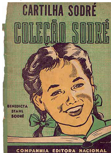
Figura 3 – Cartilha Sodré 70

A variação do método estava nas unidades de análise que podiam ser escolhidas entre letras, fonemas ou sílabas, que se juntam para formar um todo (palavra e, posteriormente, frase). A caracterização da aprendizagem da leitura pelos métodos sintéticos estava pautada no princípio da decodificação ou decifração do código linguístico. O segundo momento, o da “institucionalização do método analítico”, segundo Mortatti (2000; 2006), teve início a partir de 1890, com a reforma da instrução pública no estado de São Paulo. Com isso, assumia-se a implementação do método analítico para o ensino da leitura. Na Figura 3 está a imagem da capa da Cartilha Sodré (1940), na sua versão inicial pautada no método analítico: