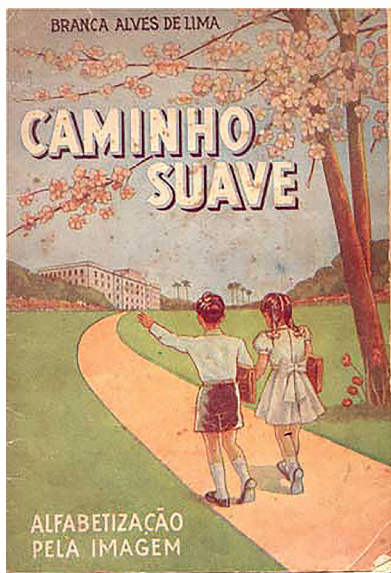
Figura 4 – Cartilha Caminho Suave 71