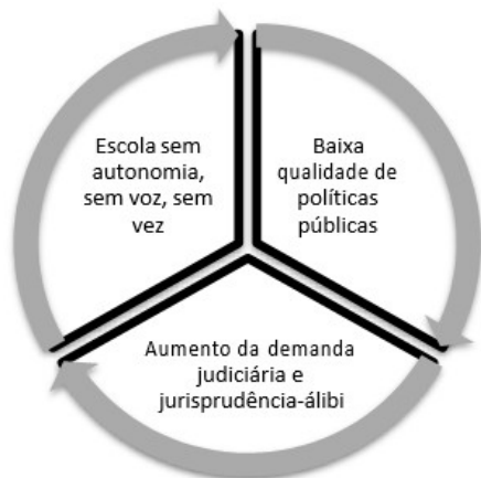
Esquema 1: Ciclo de invisibilidade institucional.

Nessa lógica, a construção jurisprudencial no Brasil, visualizada inclusive por decisões praticamente idênticas, conforme se observa nas supracitadas ementas 6 e 7, ressalta a posição solene da lei. Assim, à margem da relação processual, tal contexto faz com que a lei, muitas vezes, seja utilizada, conforme apontado por Hespanha 133 , p. 24 como forma de “enunciar de forma solene e propagandística as intenções do poder”. Dessa forma, a lei passa a não ser um instrumento de mecanismo regulativo, mas, sim, persuasivo e simbólico, realçando a posição figurativa, como mecanismo de manutenção de poder, especialmente pela transformação do arcabouço jurídico legalista, como único modo de revelação do direito.