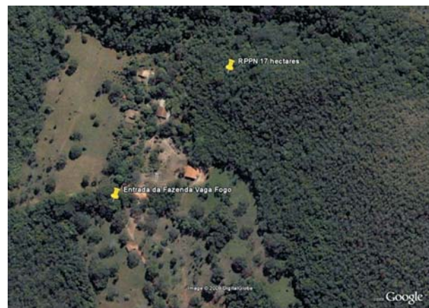
Figura 2 – Visualização parcial da Fazenda Vagafogo e de sua RPPN.

Figure 1 – Location of Fazenda Vagafogo, 5 Km away from the municipality of Pirenópolis.