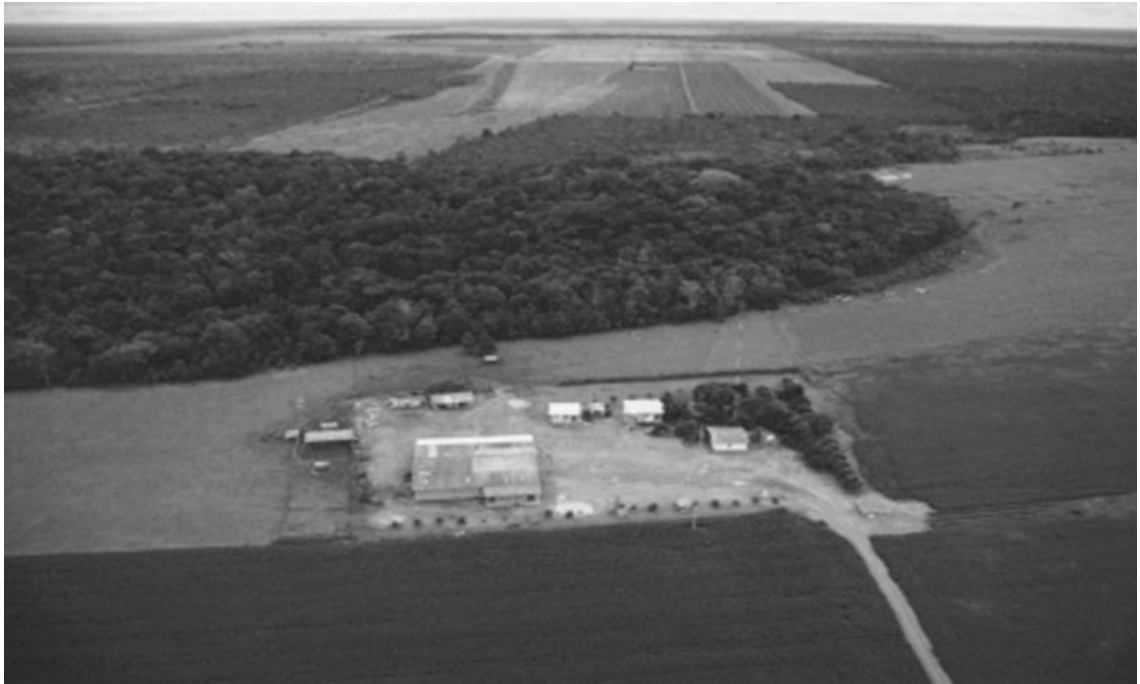
FIGURA 2 – Áreas de produção e conservação consolidadas nas propriedades rurais.

jetivo de adequar e promover a regularização ambiental. O PRA é constituído de quatro instrumentos: o CAR, o termo de compromisso, o projeto de recuperação de áreas degradadas e as CRAs quando couber, sendo o CAR a chave para monitoramento e sucesso da regulamentação ambiental, visto que é por meio dele que estarão disponíveis todas as informações integradas da propriedade com subsídios de mapas e fotos de satélites.