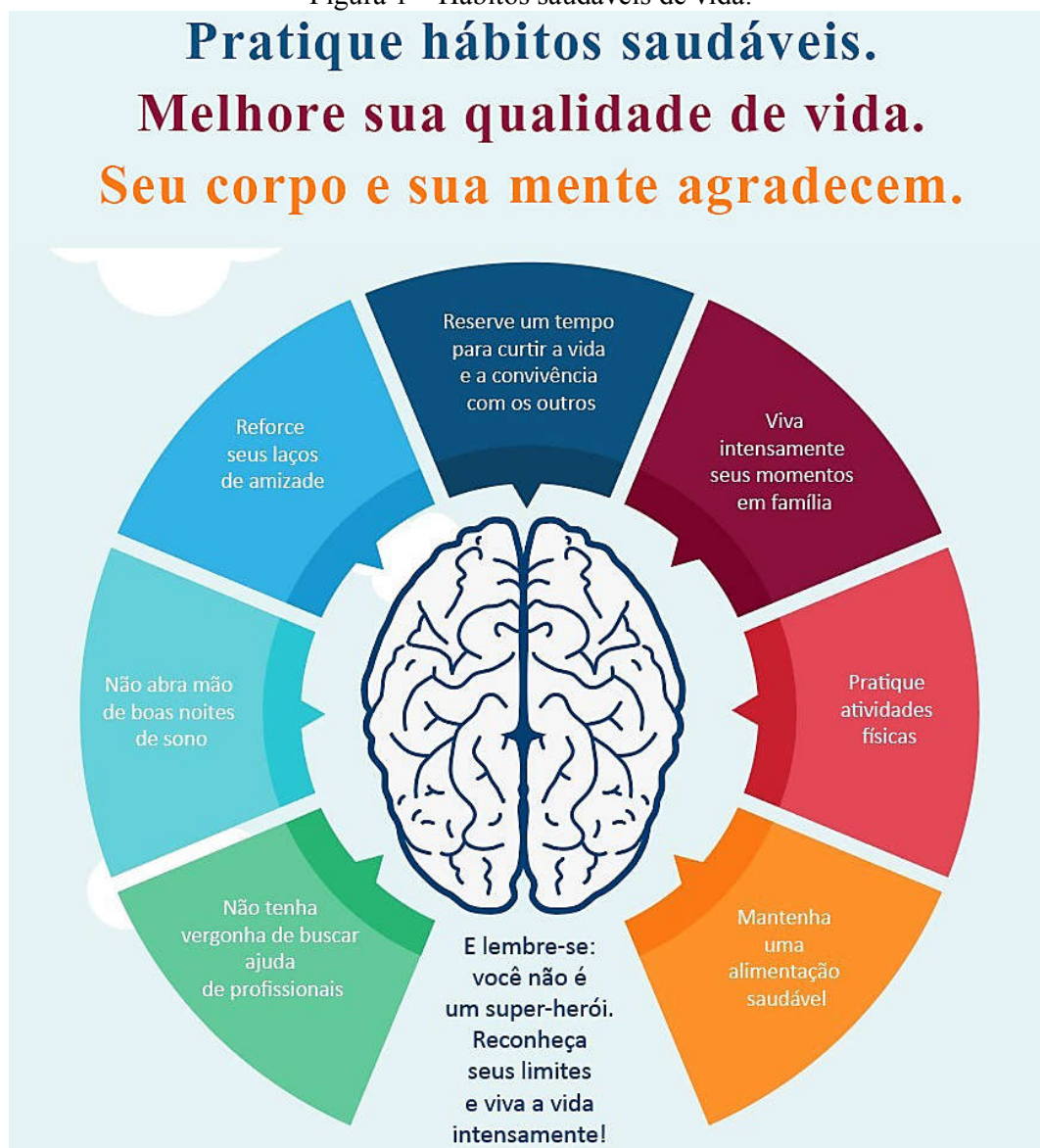
Figura 1 – Hábitos saudáveis de vida.