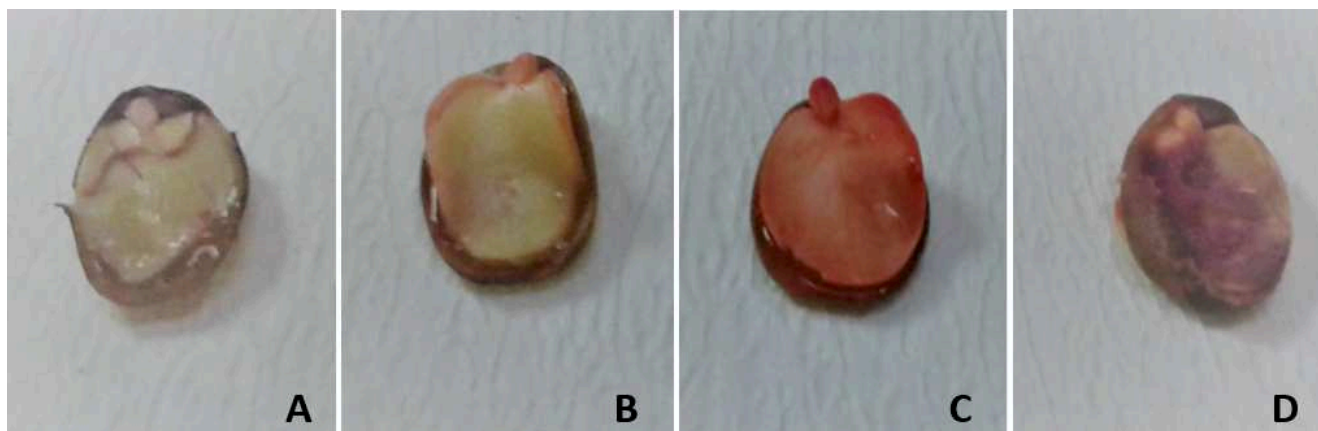
FIGURA 2: Aspecto geral da coloração de sementes de A. leiocarpa após coloração com tetrazólio. Semente morta (A), Semente viável (B e C) e semente em deterioração (D)

Médias seguidas da mesma letra na coluna não se diferem estatisticamente de acordo com teste de Tukey 5%.