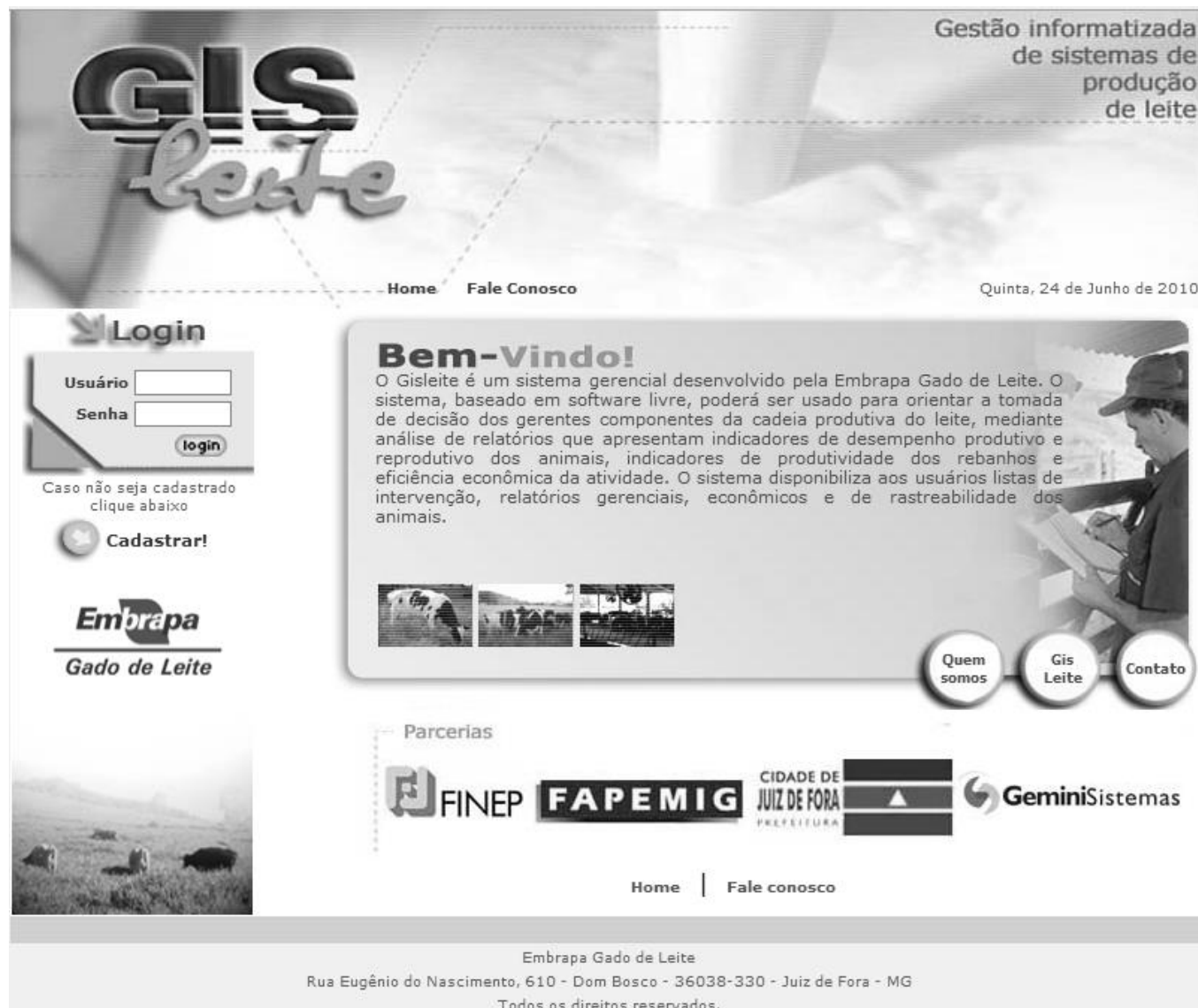
Figura 1. Tela de abertura do sistema.