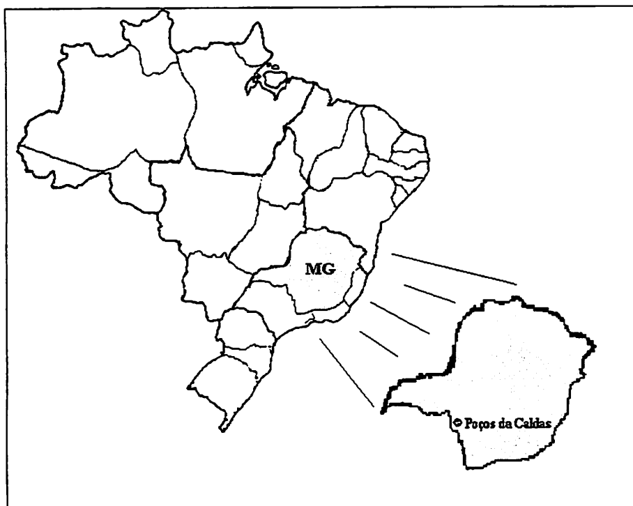
FIGURA 1 Mapa do Brasil, indicando a localização do estado de Minas Gerais e do município de Poços de Caldas

Em relação à morfologia topográfica, o município possui 7% de seu relevo plano, 57% ondulado e 36% montanhoso. A hidrografia é marcada pela bacia hidrográfica do Rio Pardo, que tem como afluente principal o rio Lambari, oriundo das junções dos ribeirões das Antas e dos Poços, ambos situados no planalto e vários pequenos tributários na planície.