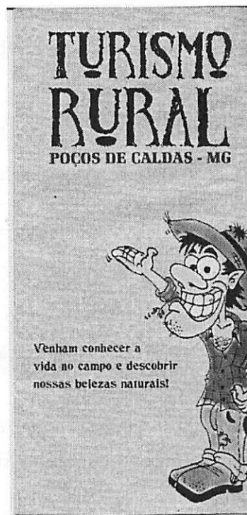
Parte da frente do Folder