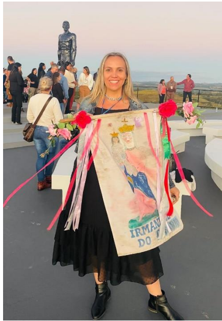
Figura 10: Benzedores dos Ternos

A bandeira de Nossa Senhora do Rosário deve sempre ir à frente do grupo.