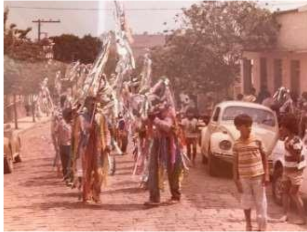
Figura 5: Festeiros em procissão