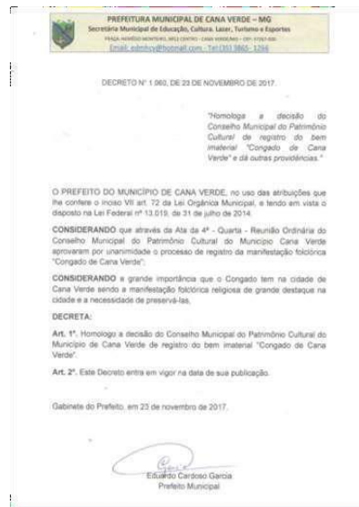
Figura 1: Registro do Bem imaterial “Congado de Cana Verde”