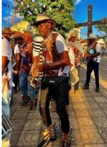
Figura 8: Folião detentor do Terno de Catopé.

o jeito de vestir e dançar dos indígenas. Utilizariam ainda cantorias irônicas e críticas sociais. Fazem uso de tamborins, viola, violões, cavaquinhos, chocalhos, caixas, reco-recos, acordeons, cuícas e pandeiros.