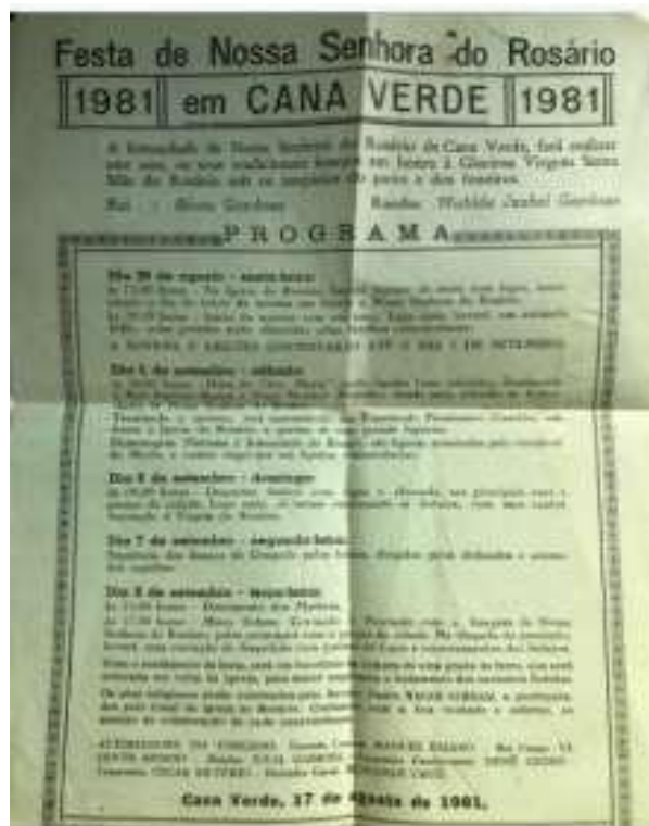
Figura 2. Programa da Festa de Congado do ano de 1981