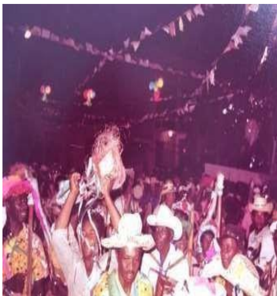
Figura 4: Imagem dos festeiros