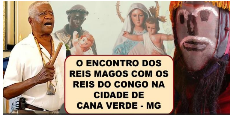
Figura 9: Documentário – Produto educacional

Assim, foi possível a realização do documentário, pois, pode-se contratar um profissional capacitado a fazer as imagens, se prestar a parte técnica e a edição.