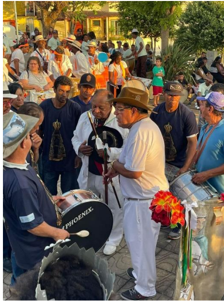
Figura 9: Benzedores dos Ternos