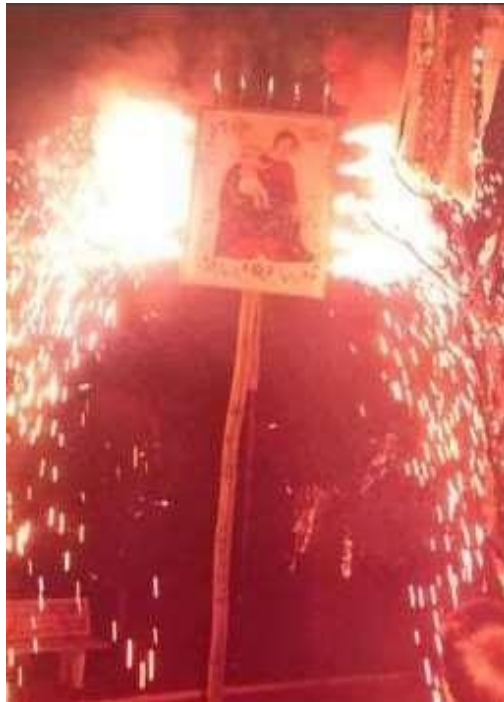
Figura 3: Mastro da Festa do Congado