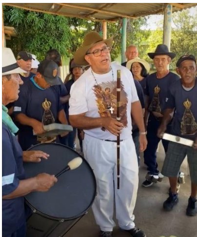
Figura 6: Terno de Moçambique

Atualmente existem duas datas anuais em que a Festa do Congado acontece: maio e outubro. Em maio, o Congado é realizado em homenagem à Nossa Senhora do Rosário e São Benedito. Em outubro, os festejos são destinados à São Benedito, Santa Efigênia e Nossa Senhora do Rosário. Atualmente existem os Ternos denominados de “Moçambique” e “Catopé”.