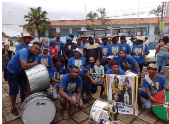
Figura 7: Terno de Catopé