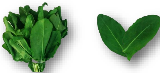
Figura 1. Folhas de azedinha (Rumex acetosa L.) antes e após a colheita.

A Azedinha ( Rumex acetosa L. ), espécie pertencente à família Polygonaceae, atinge de 25 a 55 cm de altura e forma touceiras com dezenas de propágulos. Normalmente, é encontrada em estado silvestre em regiões de clima ameno da Europa e Ásia sendo, no Brasil, cultivada do Rio Grande do Sul a Minas Gerais; contudo, raramente floresce nas condições climáticas brasileiras. Suas folhas podem ser consumidas in natura ou cozidas, embora apresentem alto teor de oxalato de cálcio, fator antinutricional que limita o consumo por pessoas que sofrem de problemas renais. Na figura 1 podem ser observadas folhas de azedinha ainda na planta e após a colheita.