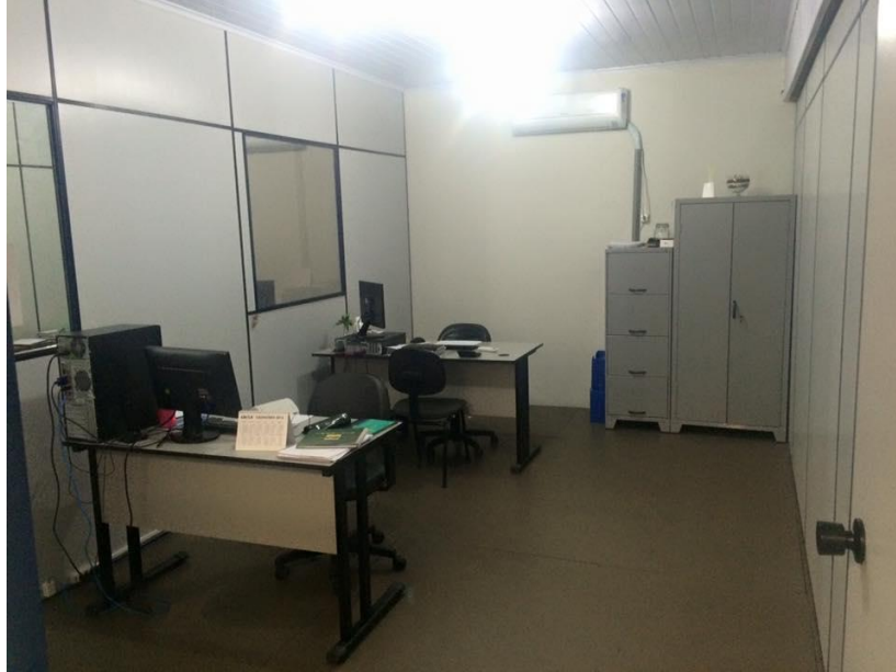
Figura 4: Sala da assistente administrativo e cobrança