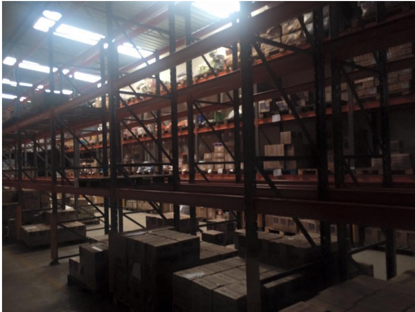
Figura 8: local onde as mercadorias são alocadas

Logo após o desembarque e conferência das mercadorias, as mesmas são encaminhadas para o local do depósito em que ficarão armazenadas, figura 8, seguindo os respectivos endereços (rua, apto, picking, pulmão) já pré-definidos pelo sistema, chamado "Piloto". Esta organização segue o método WMS ( Warehouse Management System ), o qual significa Sistema de Gerenciamento de Armazém.