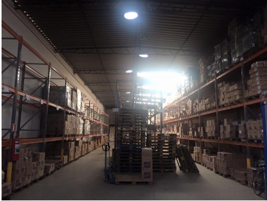
Figura 2: Estoque