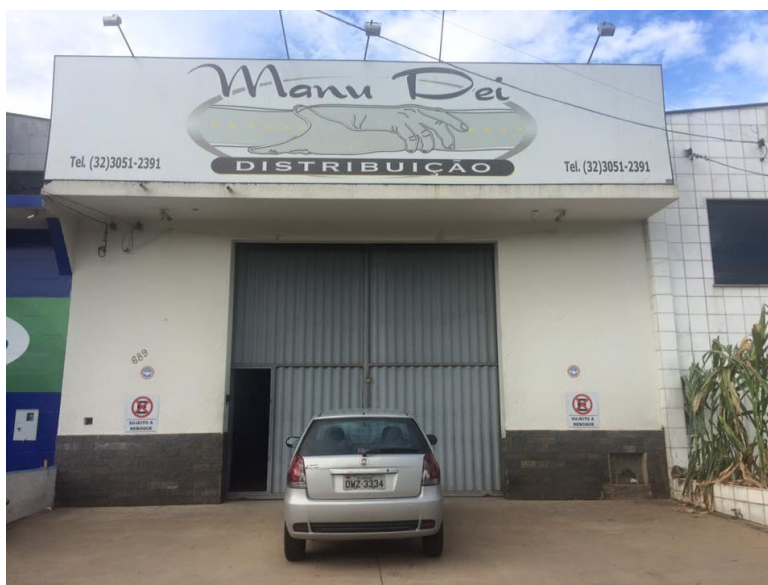
Figura 01: Fachada da empresa

proporcionando assim um fácil acesso a relatórios gerenciais, de estoque, entradas e saídas de mercadoria