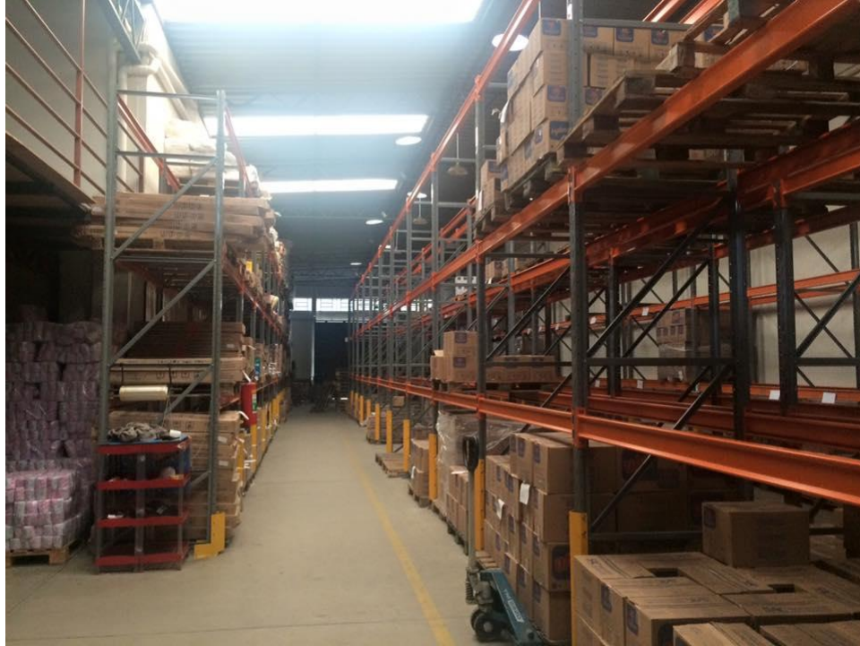
Figura 6: Estrutura de porta paletes para armazenagem de mercadoria

A Manu Dei possui a distribuição exclusiva de três fornecedores: