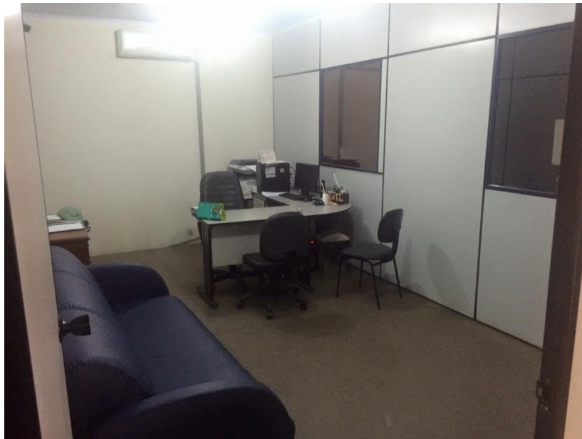
Figura 3: Sala da Diretora