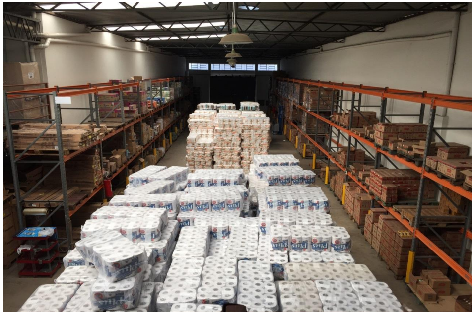
Figura 7: recebimento de mercadoria do fornecedor Copapa

Na Manu Dei, essa atividade é realizada pelo responsável do depósito da seguinte forma: quando chega a mercadoria de algum fornecedor (figura 7) o pedido é conferido juntamente a nota fiscal. Neste processo, alguns pontos principais são observados, sendo eles quantidade dos produtos, valor negociado, valor de desconto, bonificação e valor final da compra. Caso seja identificada alguma divergência, é realizado um contato com a empresa fornecedora para que seja feito um acordo, podendo ser a emissão de uma nova nota, para redução do valor no boleto, ou até mesmo para retenção do canhoto. Caso todas as informações estejam corretas, passa-se a etapa de descarga da mercadoria no depósito.