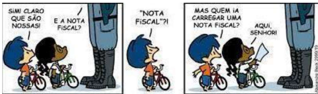
Figura 10 - Nota fiscal