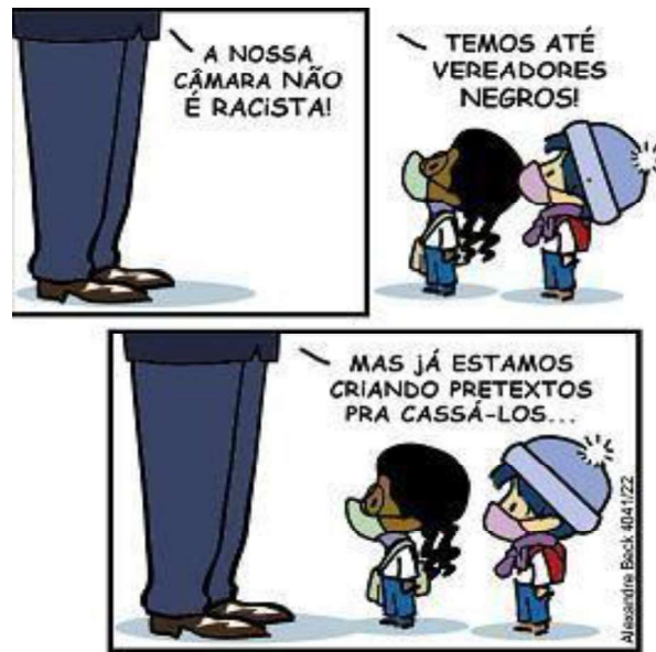
Figura 7 - Câmara de vereadores (reapresentada)