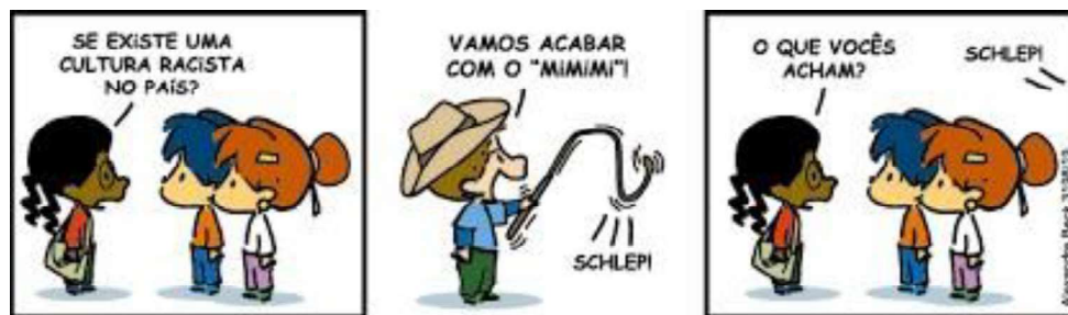
Figura 4 - Mimimi