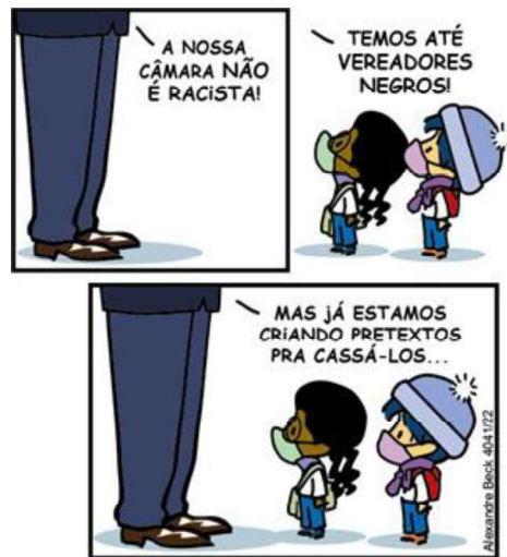
Figura 7 - Câmara de Vereadores

Fonte: https://tirasarmandinho.tumblr.com/