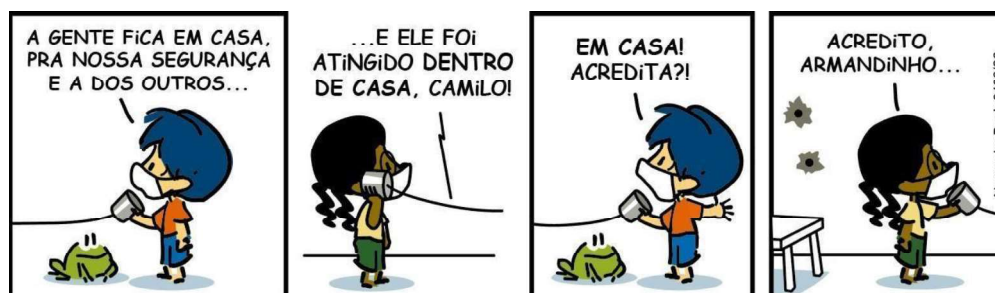
Figura 1 – Casa segura