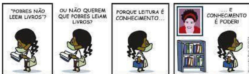
Figura 3 – O poder da leitura