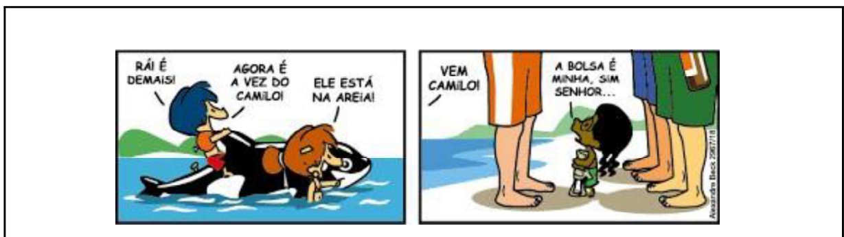
Quadro 4 – Aspectos analisados na figura 11

Assim, procuramos resumir, no quadro 4, os aspectos linguísticos e extralinguísticos analisados na figura 11, apresentando as semioses, os elementos e os exemplos: