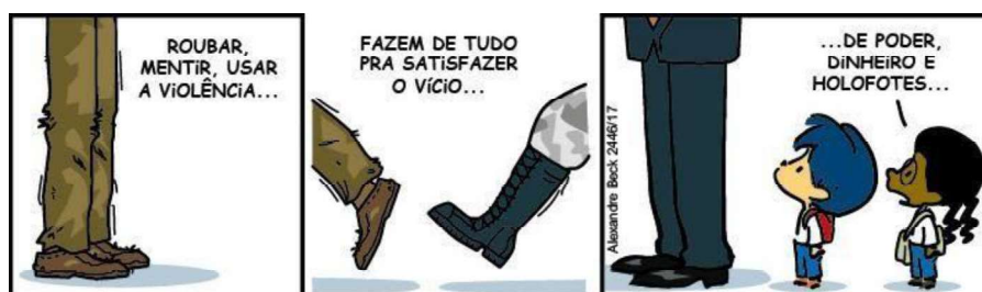
Figura 9 – O vício