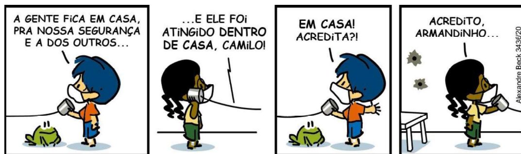
Figura 1 – Casa segura (reapresentada)