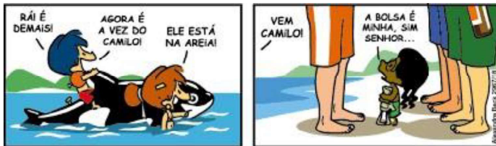
Figura 11 - Na praia