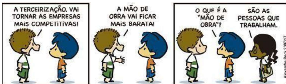
Figura 2 - A terceirização (reapresentada)