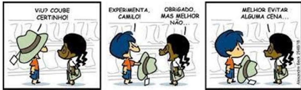
Figura 6 – Chapéu novo