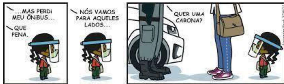
Figura 8 – A carona