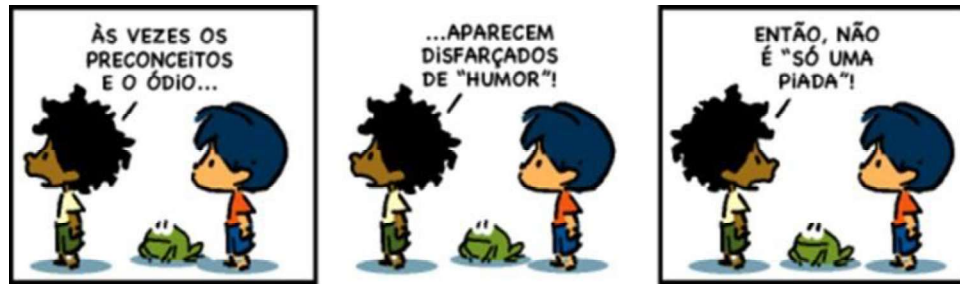
Figura 5 – Disfarçado de humor