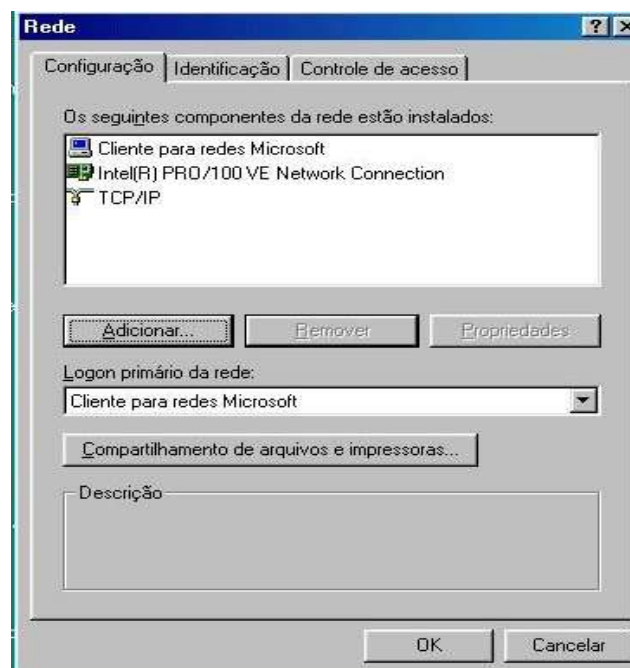
Figura 3.1: Elementos da configuração da rede do Windows 98

Para que os computadores clientes estejam na rede e se comuniquem com o Samba, é imprescindível o protocolo TCP/IP 21 e o Cliente para redes Microsoft, conforme mostrado na figura 3.1.