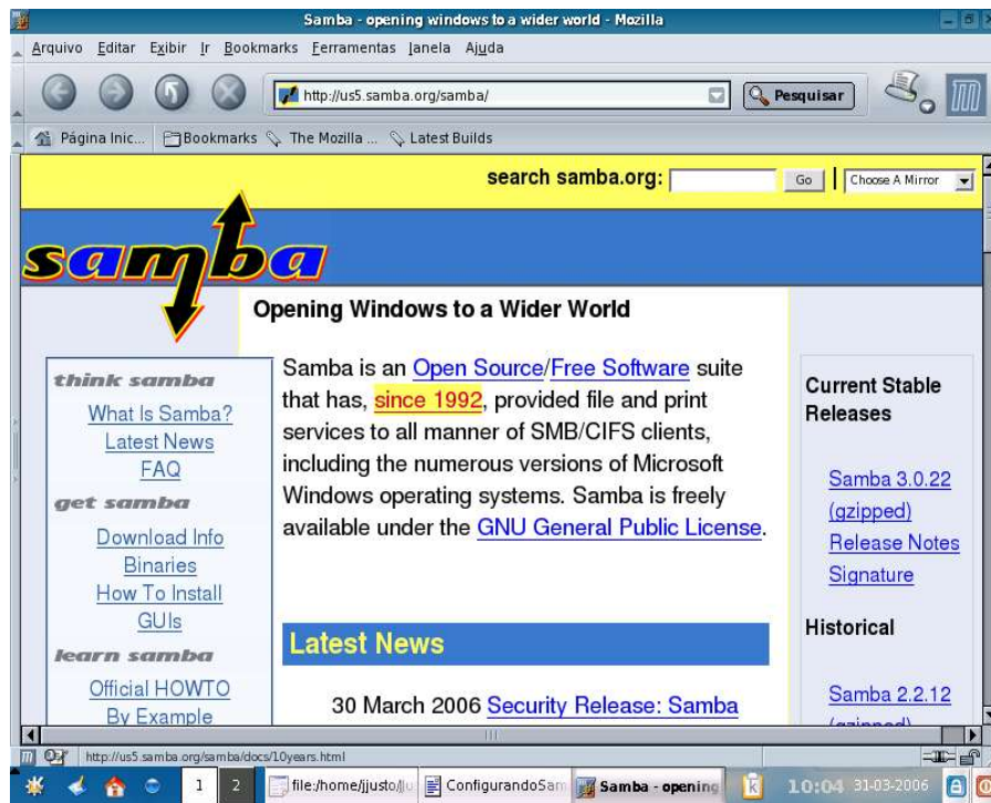
Figura 2.1: Site do projeto Samba.

Atualmente o Samba é mantido por uma equipe de aproximadamente 30 desenvolvedores, entre ativos e contribuidores regulares. Na figura 2.1 é mostrada a página inicial do site 11 do projeto Samba.