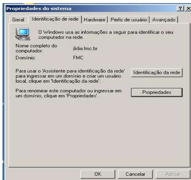
Figura 3.5: Máquina com sistema Windows 2000 que participa do domínio fmc.