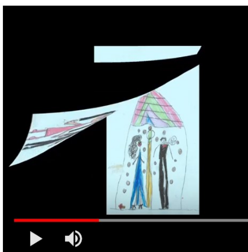
Figura 6 - Retextualização digital: “Até os príncipes arrotam”

a) Como a gente percebe que a história muda de cena? A discussão permitiu aos alunos perceberem que o recurso de analogia de mudança de página foi usado para a mudança de telas. Esse recurso (semiótico) de movimento traz dinamicidade ao texto e favorece a mobilização da atenção do espectador.