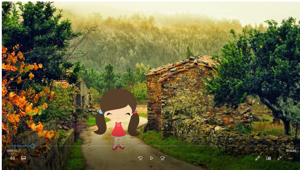
Figura 3- Retextualização digital: Scinder de Nevi