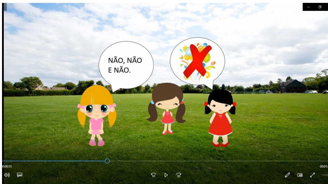
Figura 4- Retextualização digital: Scinder de Nevi

Na figura 4, observa-se que as estratégias utilizadas pelas crianças evidenciam a mobilização de conhecimentos prévios sobre a linguagem e seus usos.