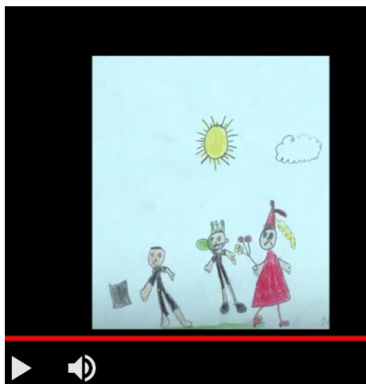
Figura 8 - Retextualização digital “Até os príncipes arrotam”