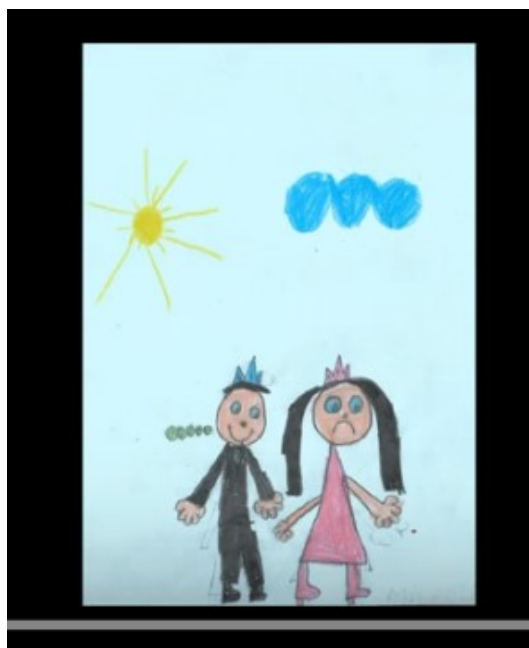
Figura 7 - Retextualização digital “Até os príncipes arrotam”