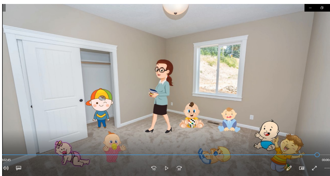
Figura 5 - Retextualização digital: Scinder de Nevi

Por fim, na figura 5, a construção da imagem pelas crianças suscita possibilidades interpretativas.