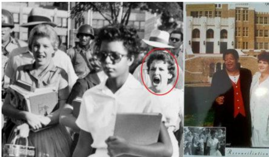
Figura 1.4 Elizabeth Eckford e Hazel Bryan em 1957 e em 1997