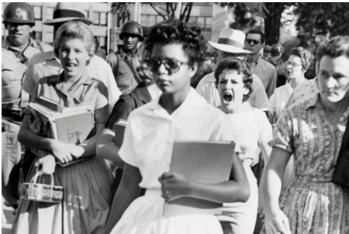
Figura 1.2 Elizabeth Eckford em Harding High School em Charlotte, na Carolina do Norte