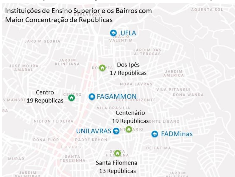
Figura 2 - As instituições de ensino superior e os bairros de maior concentração de repúblicas.

Sayegh (2009, pag.23) afirma que as cidades universitárias possuem um adensamento, em determinadas regiões, sobretudo, nos bairros centrais e ou próximos aos campis universitários. Em Lavras, os bairros de maior concentração são o Centro com 19 Repúblicas, Centenário e dos Ipês com 17 Repúblicas cada e Santa Filomena, com 13 Repúblicas. Essa distribuição pode ser observada na Figura 2.