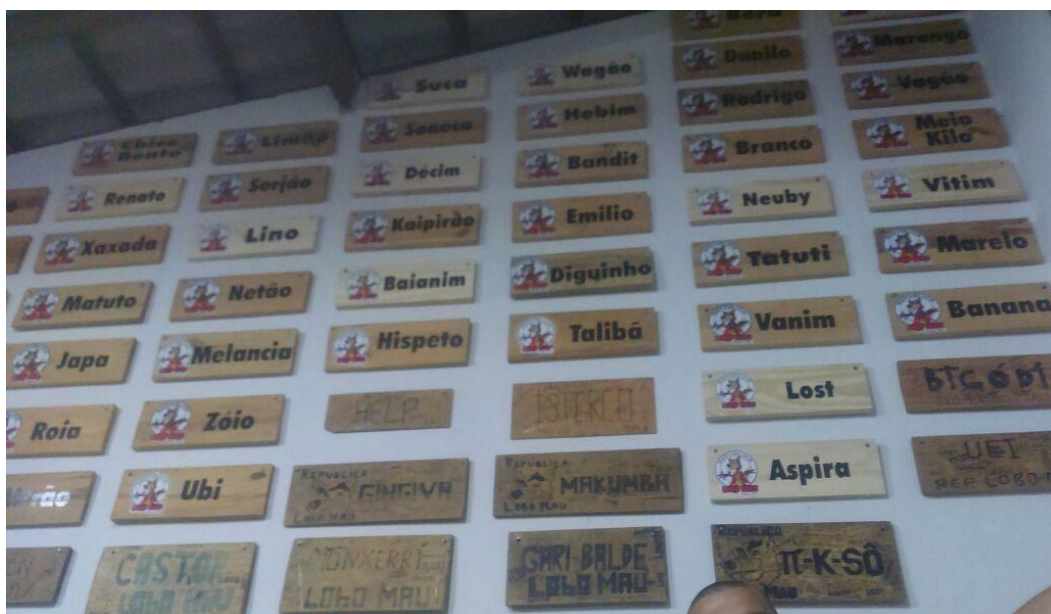
Figura 5 - Placas de moradores e ex-moradores da república Lobo Mau.