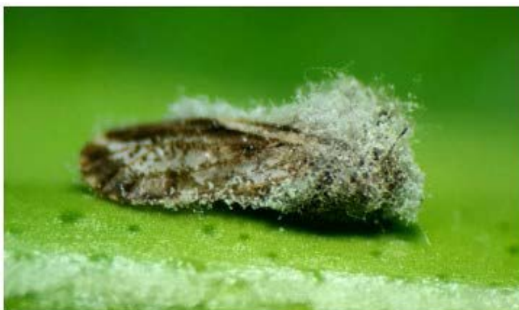
Figura 6: Isaria fumosorosea , fungo entomopatogênico utilizado no controle de Diaphorina citri .

O fungo entomopatogênico Isaria fumosorosea Wize, 1904 (Hypocreales: Cordycipitaceae) (Figura 6) também é uma alternativa para controle da D. citri . Após a pulverização do fungo na lavoura, os esporos se fixam e penetram no corpo da praga. Dentro do corpo do inseto, o fungo produz toxinas que causam a sua morte. Uma das características deste biológico é deixar uma camada esbranquiçada de esporos no corpo do inseto após a sua morte.