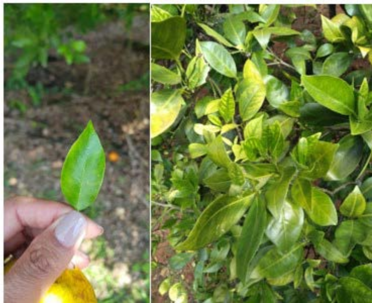
Figura 2: Sintomas de greening nas folhas de citros.

De modo geral, as plantas apresentam debilidade, podendo ocorrer desfolha precoce, subdesenvolvimento, morte de ponteiros e folhagem esparsa. Nas folhas, a planta apresenta amarelecimento nas nervuras e mosqueamento assimétrico, que consiste em um gradiente de cores que vai de verde escuro até amarelo, sem separação nítida entre elas, algumas vezes aparentando deficiência nutricional. A planta pode também apresentar apenas um ramo sintomático ou os sintomas podem se manifestar em toda a planta. A Figura 2 exemplifica os sintomas de greening em folhas de citros.