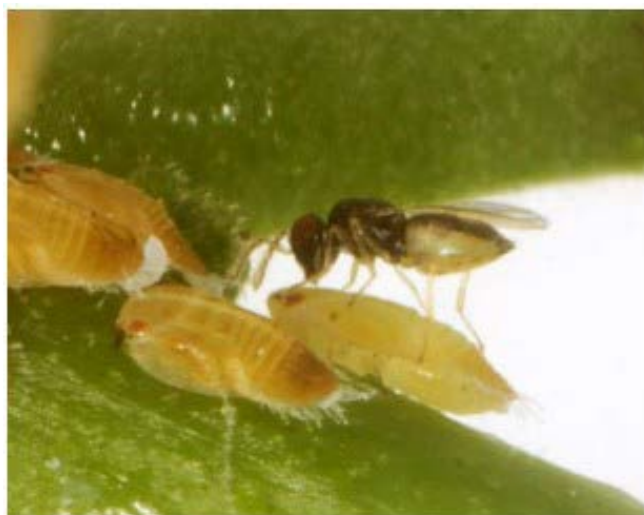
Figura 5: Vespa Tamarixia radiata utilizada no controle de Diaphorina citri .