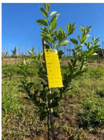
Figura 4: Armadilha adesiva amarela para monitoramento do psilídeo.

O monitoramento deve ser feito para determinar os períodos de entrada dos psilídeos no pomar e para orientar a frequência de pulverizações, além de indicar por onde os insetos estão vindo. As informações do monitoramento devem ser registradas e organizadas por todos os citricultores. O monitoramento pode ser feito com armadilhas adesivas amarelas cuja leitura deve ser feita a cada sete dias e a troca a cada duas semanas. As armadilhas devem ser instaladas no terço superior das plantas das bordas da propriedade e a uma distância de 150 a 250 metros entre si. Deve-se utilizar as duas faces e armadilhas com tamanho mínimo de 10 cm x 30 cm (Figura 4).