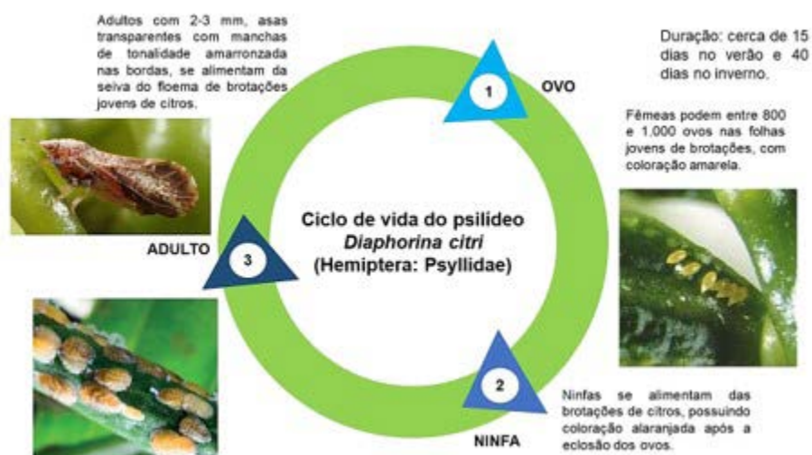
Figura 1: Ciclo de vida do psílideo Diaphorina citri , inseto vetor do greening .

alimentando-se das brotações de citros. O psílideo adulto, por sua vez, é um inseto relativamente pequeno (2-3 mm), com asas transparentes havendo manchas de tonalidade amarronzada nas bordas.